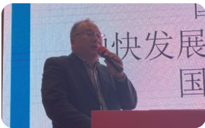
国家对医疗器械技术发展的新业态新模式的要求 医疗器械研究所有限公司，董事长