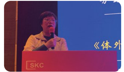
医疗器械注册相关法规及申报要求动态 上海药监局，首席审评