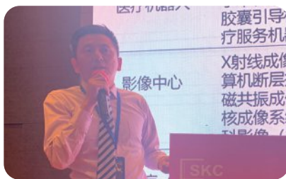
PC控制系统助力高端医疗器械国产化 德国倍福自动化有限公司，行业经理