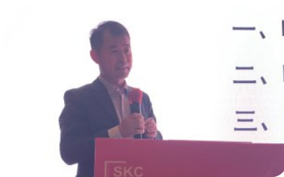
听力康复产品发展状况 上海力声特医学科技有限公司， 董事长