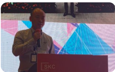
沪雅科技创新 上海沪雅科技有限公司，总经理