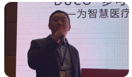
多可协作机器人- 为智慧医疗引入更多可能 中科新松有限公司，大区经理