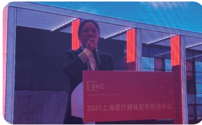
智能电动工具在医疗设备生产中的应用 马头动力工具，高级产品专员