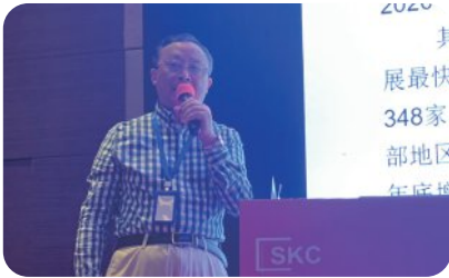
医疗器械产业的现状与发展 上海医疗器械行业协会，副秘书长